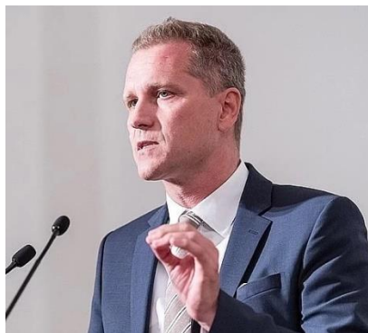
Депутат бундестага ФРГ Петер Быстрон,